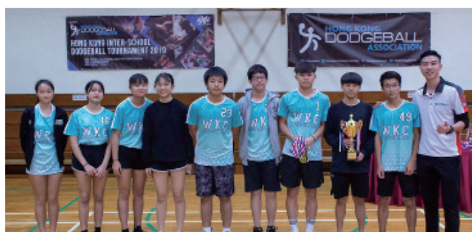
香港第一屆美式閃避球比賽「全港中學閃避球錦標賽2019」中榮獲初中組冠軍