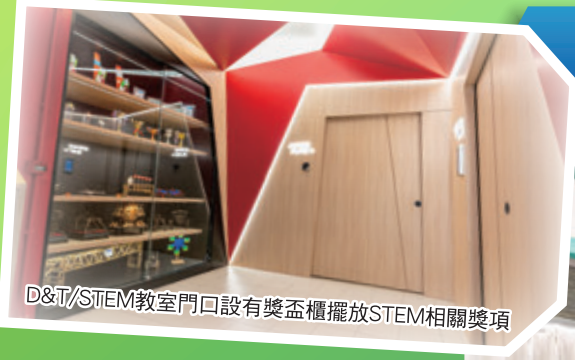
D&T/STEM教室門口設有獎盃櫃擺放STEM相關獎項