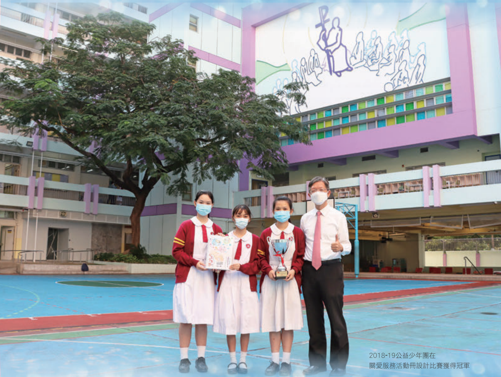
2018-19公益少年團在 關愛服務活動冊設計比賽獲得冠軍

參賽學校探訪和服務傷健機構、老人院等，之後將服務活動前後的花絮及進行情況配以文字及圖片製成活動冊報告參賽。在2018-2019年度，我校公益少年團的服務對象主要是長者，所以愛心冊內記錄了我們體驗長者生活的活動內容和與長者互動的片段。